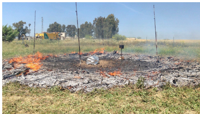
Innentemperaturen im vollständigen Strahlungswärmetest